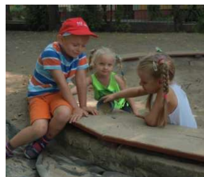
„Mamy tu zabawek wiele razem bawić się weselej...”