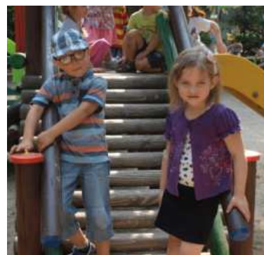
Na przedszkolnym podwórku.