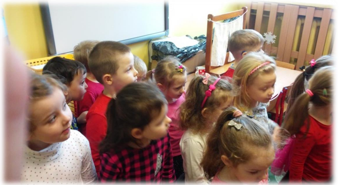
„Krasnoludki” rozdają walentynki