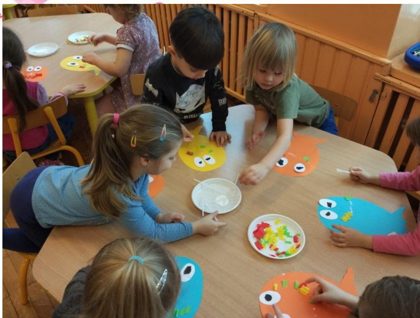
Dzieci tworzą pracę plastyczną pt.: „Happy balloon”