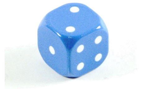
Konstruowanie gry - opowiadania.