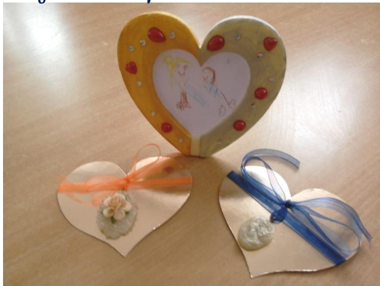
A to już nasze upominki dla babci i dziadka.