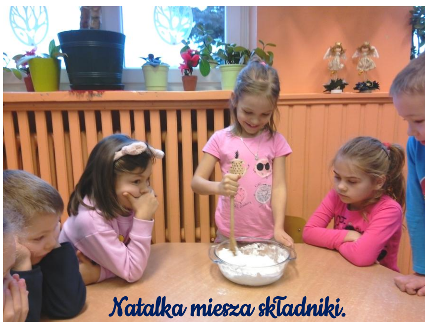
Zaczynamy łączyć ze sobą wszystkie składniki masy.