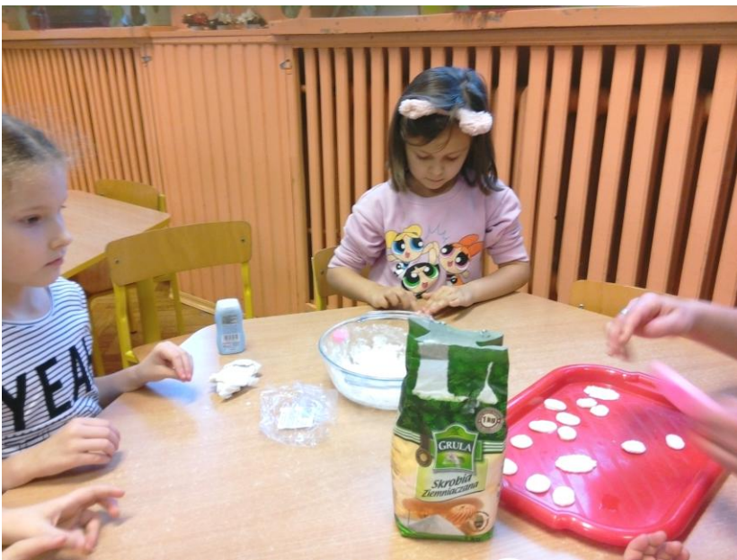
Teraz dzieci robią odciski wykorzystując formę silikonową.