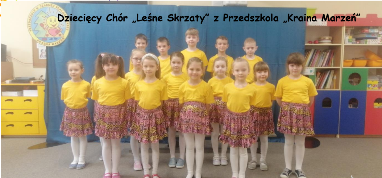
Dziecięcy Chór „Leśne Skrzaty” z Przedszkola „Kraina Marzeń”