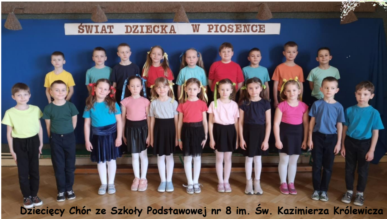
ŚWIAT DZIECKA W PIOSENCE