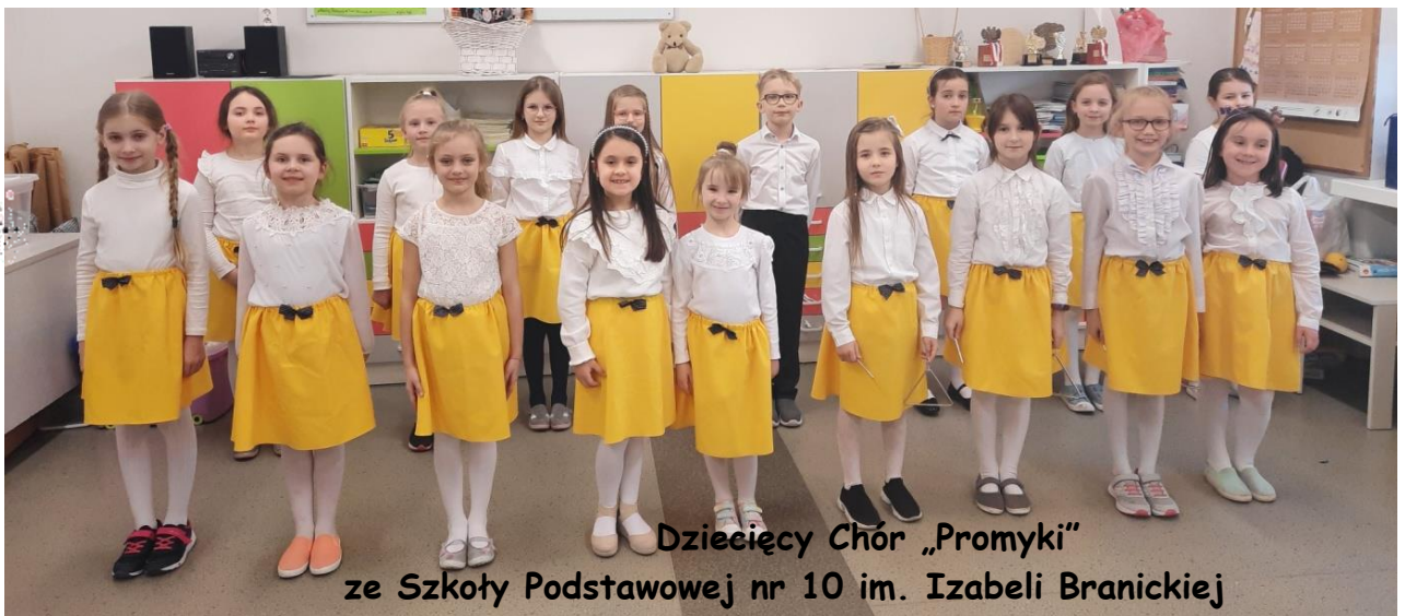
Dziecięcy Chór „Promyki” ze Szkoły Podstawowej nr 10 im. Izabeli Branickiej