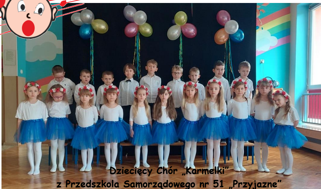
Dziecięcy Chór „Karmelki” z Przedszkola Samorządowego nr 51 „Przyjazne”