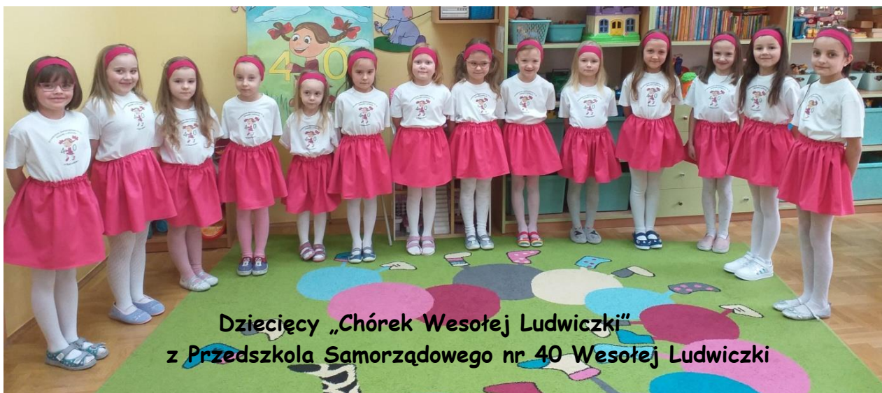
Dziecięcy „Chórek Wesolej Ludwiczki” z Przedszkola Samorządowego nr 40 Wesolej Ludwiczki