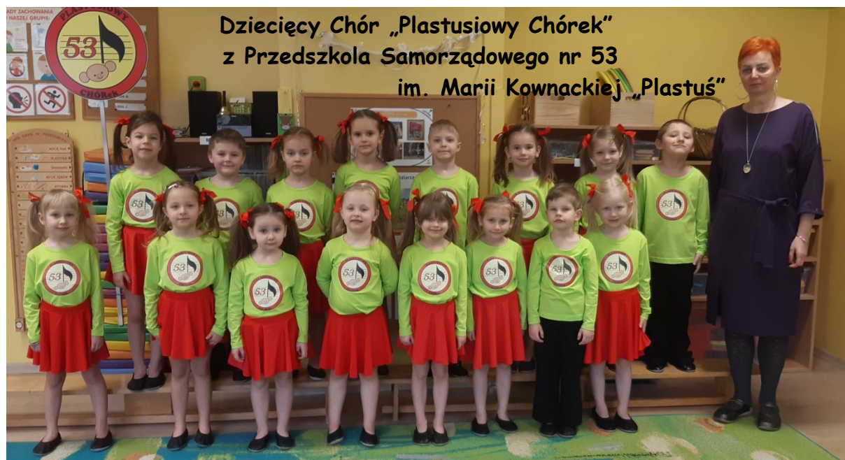
Dziecięcy Chór „Plastusiowy Chórek” z Przedszkola Samorządowego nr 53 im. Marii Kownackiej „Plastuś”